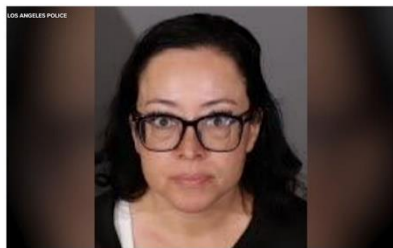
La police de Los Angeles a publié la photo de l'enseignante qui a été placée en détention.