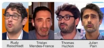
15:44 · 16 avr. 23 · 94,2K Vues