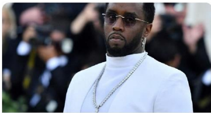
lemonde.fr Affaire Diddy : un déferlement de fausses informations, images et vidéos détournées sur le...

Le Monde revient sur les infox conspir autour de Diddy. "Elles sont toutes au service de deux ambitions : générer de l'audience facilement ou salir des personnalités publiques". Avec une mention spéciale aux TuNnELs.